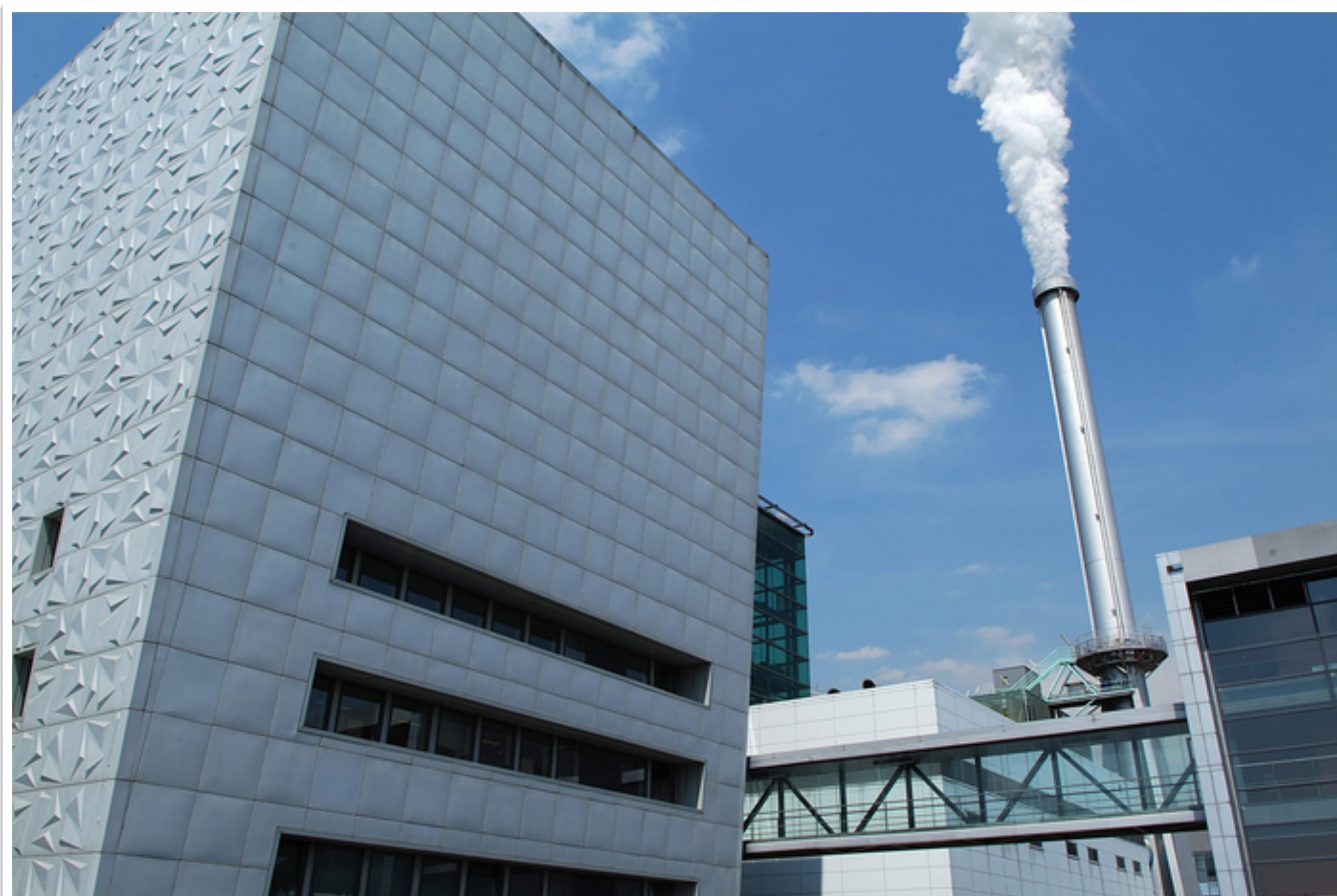
IVRY SUR SEINE Francia 2007